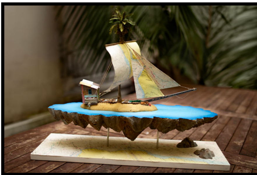
Création La Fratrie, "De grandes espérances", Carte originale d'Armel Tripon ©Trésor à la Carte, 2024

Après une première édition en 2019 qui avait permis de collecter près de 50 000 euros, "Un Trésor à la Carte" s'affirme comme un rendez-vous solidaire alliant le monde de l'art et celui de la mer. Les artistes participants ont pour seule et unique contrainte de produire leur oeuvre sur le support d'une carte marine offerte par un navigateur ou une navigatrice, faisant ainsi de chaque pièce une création artistique et maritime unique.